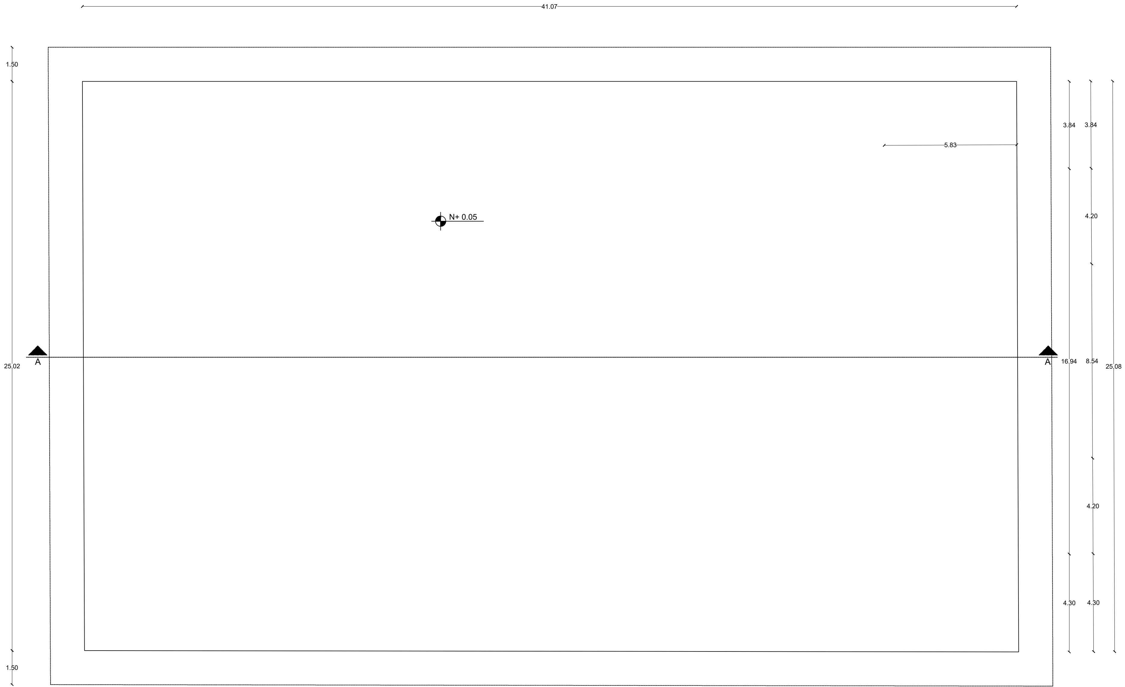
CANCHA DE FUTBOL - PLANTA ESCALA 1:50